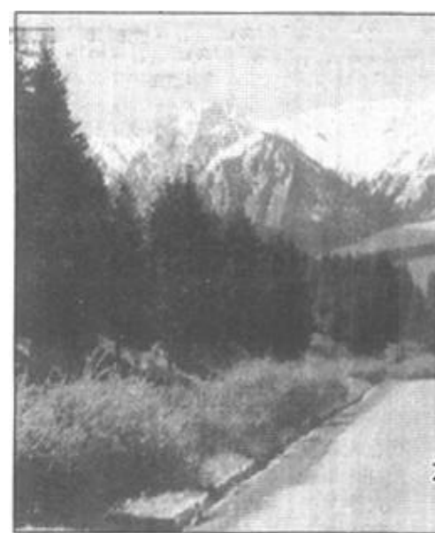
走向天山

《诸世纪》是400多年前一个叫诺查丹玛斯的法国医生写的一部著作。这本语言晦涩难懂的书,预测了1000年的吉凶。书中第十章有首诗这样写道:“1999年7月上,恐怖大王从天而降,蒙古大王重新出现……”此书在全球流传甚广,欧洲、北美、韩国和日本的不少宗教教主纷纷发出“世界大限将临”的悲号。这就是1999年人类大劫难预言的最初来源。